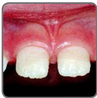
Reparatie na tandletsel